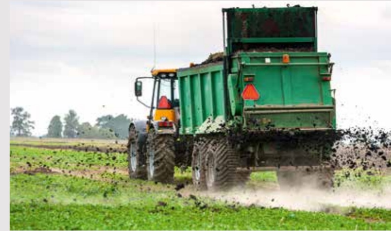
Ein Drittel des Klärschlammes landet derzeit als Dünger auf den Äckern.

„Das bedeutet, dass dann auch wir in Sehnde versuchen müssen, die Masse an Klärschlamm zu reduzieren“, betont Korf. Dieses jedoch gehe nur durch neue Anlagen, also Neuinvestitionen. So könne der mit 75 Prozent sehr hohe Wassergehalt des Klärschlammes auf bis zu zehn Prozent reduziert werden. Wichtig ist Korf schon jetzt, dass die Bevölkerung für dieses Thema frühzeitig sensibilisiert wird: „Der