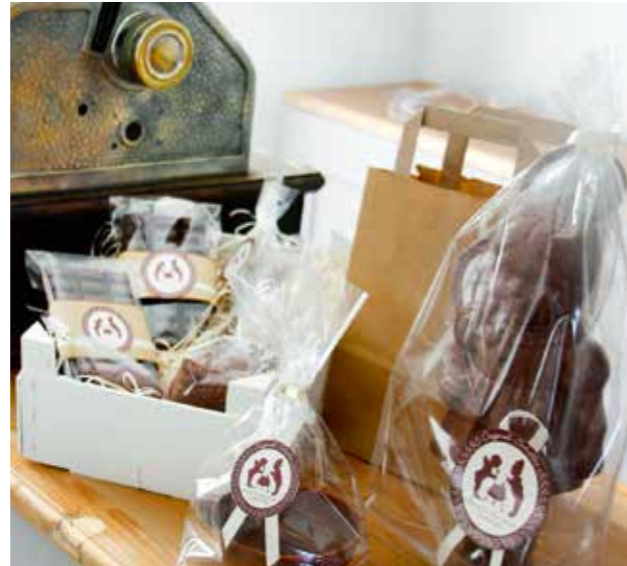
Hier trifft traditionelle Handwerkskunst auf viel Genuss.