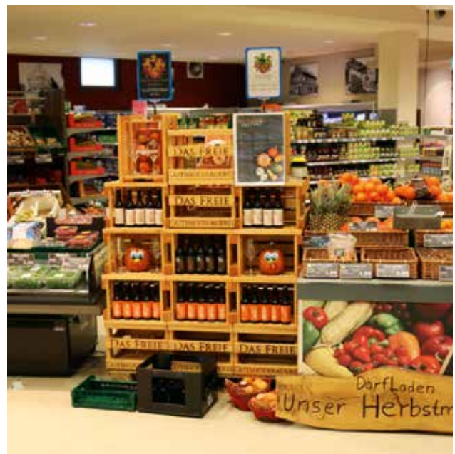
Immer appetitlich – die Ware wird jeden Tag frisch geliefert.

Abschließend stellt Digwa fest: „Als kleiner Markt sind wir ganz dicht an den Kundenwünschen. Wir wollen, dass unsere Kunden sich bei uns wohlfühlen und täglich wiederkommen. Daher suchen wir immer wieder das Gespräch und bieten persönliche Unterstützung, auch bei Sonderwünschen.“