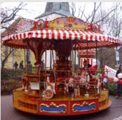
Drehen Sie Ihre Runden mit unserem nostalgischen Kinderkarussell.