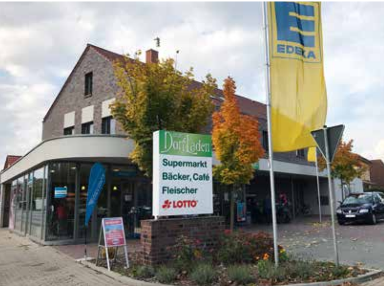
Im Dorfladen Rethmar macht das Einkaufen Spaß.

Hier finden die Kunden nicht nur viele lokale Delikatessen und Spezialitäten, sondern auch alles, was sie täglich benötigen. Die Waren werden nach Möglichkeit frisch aus der näheren Umgebung besorgt oder von EDEKA geliefert – dieses besondere Konzept verfolgt der Dorfladen Rethmar mit seinem Angebot und seinem Ambiente. Dazu gibt es im Geschäft die Möglichkeit, sich zu treffen, zu klönen, Delikatessen zu genießen und alles um den Wocheneinkauf im gemütlichen Umfeld zu erledigen.