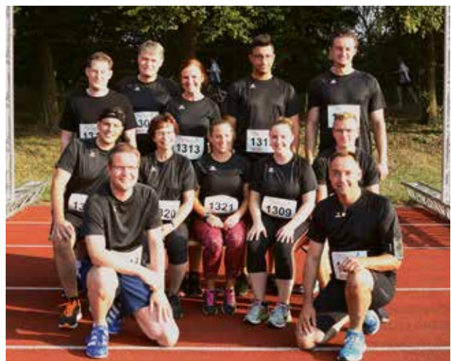
Geschafft – unsere glücklichen Läuferinnen und Läufer im Ziel.

Am 9. September 2016 nahmen bis zu 5.500 Teilnehmer aus 190 Unternehmen teil, somit gab es einen neuen Teilnehmerrekord. Zu den Firmenläufern der 5,1 km langen Strecke gehörten auch unsere Kolleginnen und Kollegen der Stadtwerke und Energieversorgung Sehnde. Sie waren zum ersten Mal mit dabei und genossen diese ganz besondere Atmosphäre.