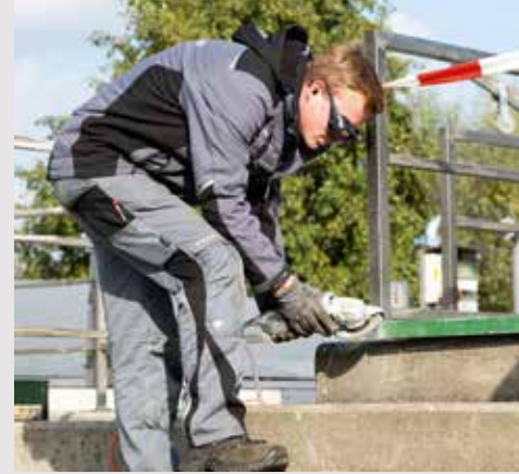
Für alle, die gerne auch mal draußen arbeiten.

Mein Tipp an alle, für die diese Ausbildung vielleicht in Frage kommt: Viele Leute haben eine falsche Vorstellung von dem, was hier gemacht wird. Deswegen wäre es gut, vielleicht einfach mal ein Praktikum zu absolvieren, um zu sehen, was man selber davon hält.